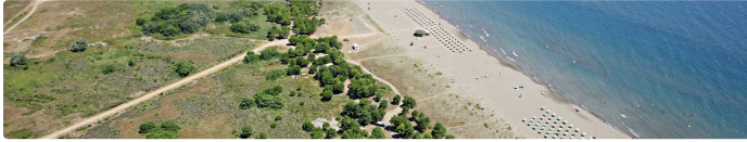
VELIKA PLAŽA — 12 KM SANDSTRAND, 60 M BREIT

32 KM KÜSTE · 1,57 MIO. ÜBERNACHTUNGEN 2025 · BIS 30 MRD. € UAE-INVESTMENT