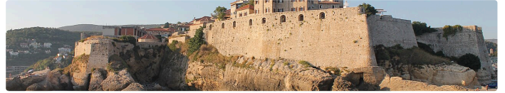
STARI GRAD — HISTORISCHE ALTSTADT, SONNENUNTERGANG

Ulcinj ist die südlichste Stadt Montenegros — mit 32 km Küstenlinie (längste des Landes), der berühmten Velika Plaža (12 km Sandstrand, 60 m breit) und über 1,57 Millionen Übernachtungen im Jahr 2025 . Die Region wächst unaufhaltsam: 315.000–320.000 Touristenankünfte pro Jahr, ein Anteil von 12,2 % am Gesamt-Tourismus Montenegros — bei einer Stadtbevölkerung von nur 11.488 Einwohnern.